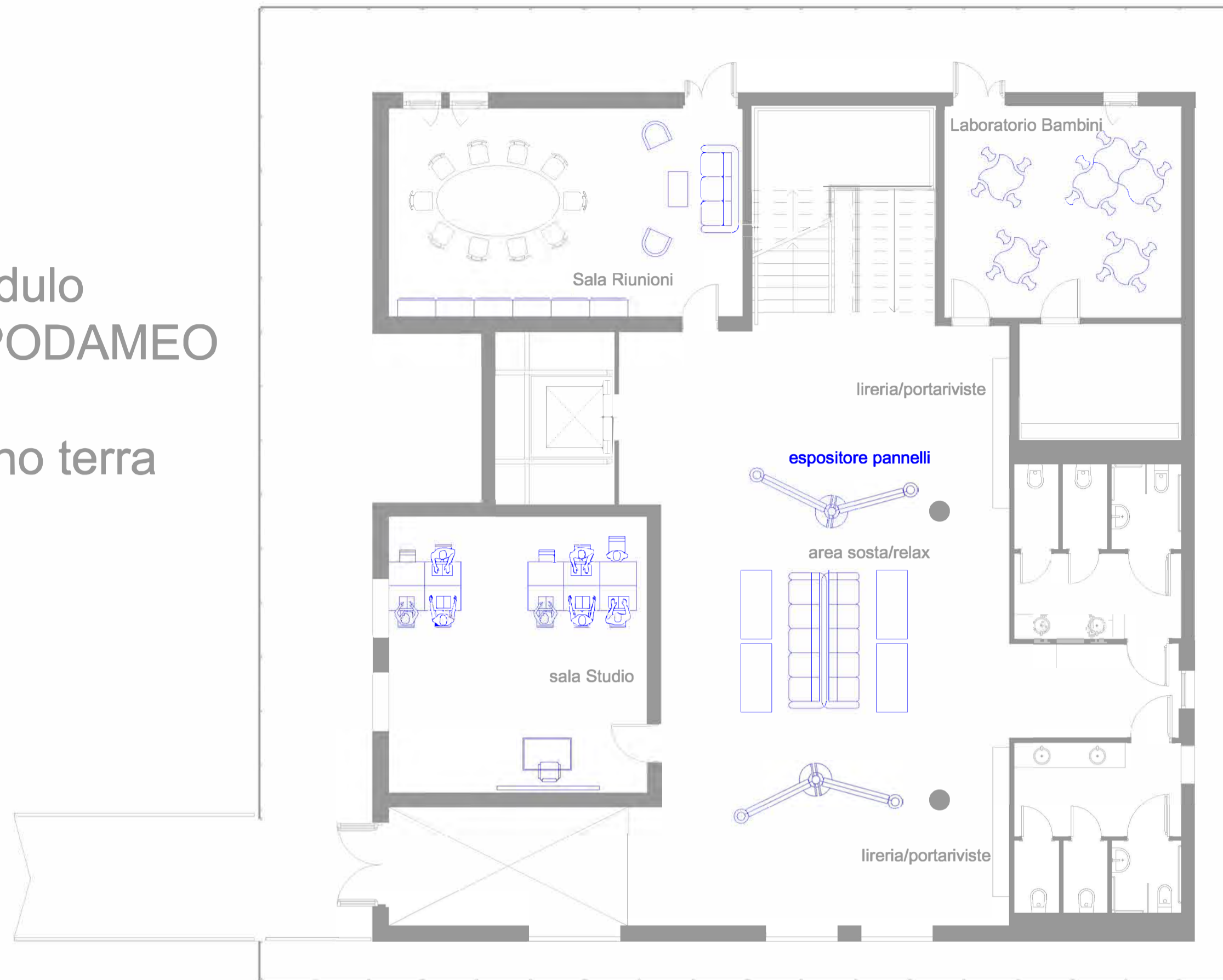
tipologia arredi area relax