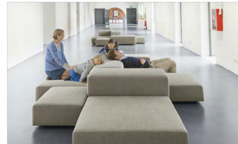
tipologia arredi area relax